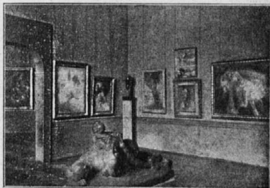
Pogled v prostore Narodne galerije leta 1922. (Druge slike k temu članku glej na prilogi v bakrotisku.)

Narodna galerija sedaj ureja in instalira v svojih prostorih ta združeni umetnostni material, ki naj pokaže dela likovne umetnosti šestih stoletij iz gotskega, renesančnega, baročnega, klasicističnega in modernega časa na domačih tleh. Prihodnje leto bo moči na tem mestu zopet govoriti o uspelosti tega podjetja. Gotovo pa je že sedaj, da bo mogla Narodna galerija uspešno služiti umetnostnim stremljenjem naše preteklosti in sedanosti le tedaj, kadar bo njena eksistenčna možnost bolj urejena, kakor je bila doslej; sedaj, ko so premagane že mnoge začetne težave, se morajo najti tudi sredstva za vzdrževanje galerije, k čemur pomagajmo Slovenci — vsak po svoji moči — z besedo in dejanjem.