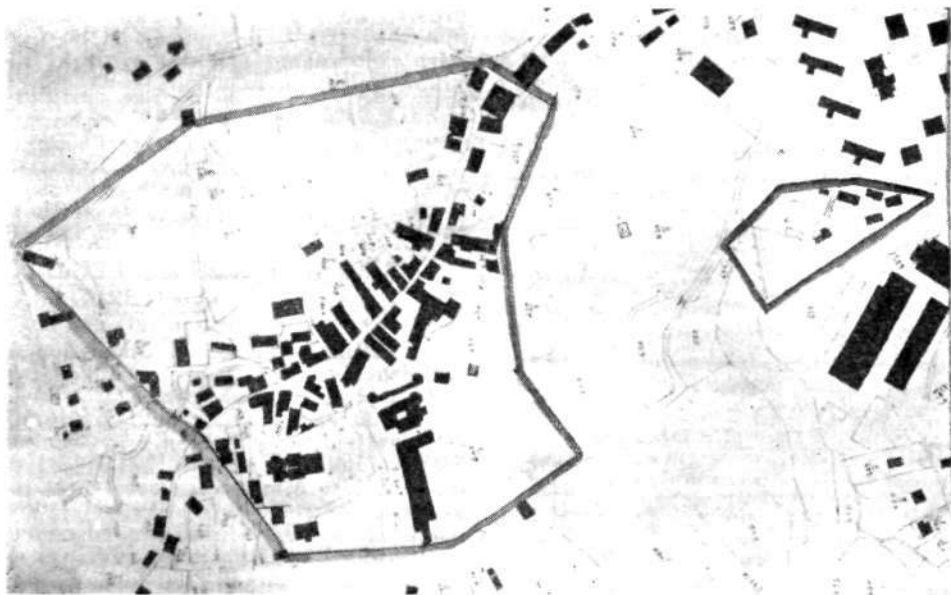
Spomeniškovarstveno zaščiteno področje okoli Krevsove domačije in v Stari Loki