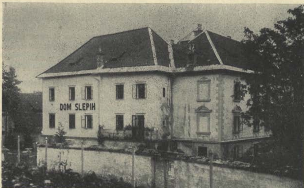
Dom slepih v Stari Loki.