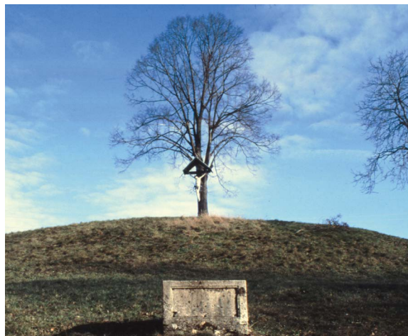
Posnetek klade v vznožju starološkega Gavžnika in Prtižovega križa na vrhu je nastal leta 2002.

V pravokotno vdolbino za nekdanji starološki trški križ je kovač zakoval železno pušico, nabiralnik (Opferstock), ki je bil zaklenjen z žabico. Da dež ni namakal denarnih darov, je kovač naredil tudi kovinsko hišico z valovito streho, ki je pokrivala cel kamen. V vdolbinah so bile verjetno vstavljene lesene poslikane table. Neznani slikar je leseno tablo, ki je zapirala zadnjo stran male kapelice, porisal s farnim zavetnikom, sv. Jurijem. Na sprednji vdolbini je bil Jezus v grobu z dvema angeloma ob strani in Kalvarijo, tremi križi v ozadju. Na desni strani, v smeri proti mestu, podoba sv. Jakoba, na levo proti Crngrobu pa Marijino oznanjenje. Znamenje je propadalo, zlasti po 2. svetovni vojni, slike so izginile, v šestdesetih letih je izgubilo še kovinske dele. Danes na občinski meji, pod novo soseško, čaka na morebitne lepše čase.