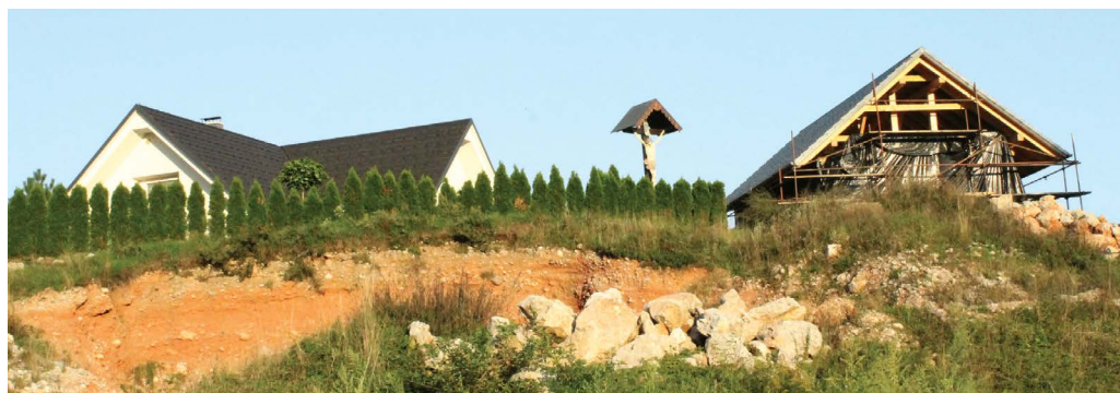
Križ na Gavžniku leta 2015.