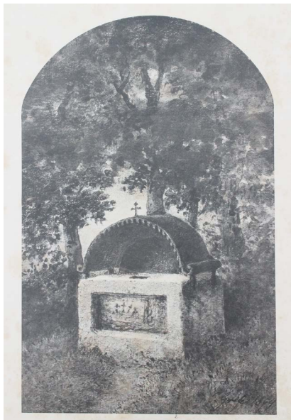
Konrad Grefe, Opferstock (»božja skrinjica«, darilna skrinjica, pušica) bei Bischoflack, akvarel, 1900.

Ob cesti za Crngrob, nasproti blokov Groharjevega naselja, se nahaja neugledna in zapuščena kamnita klada obdelanega škofjeloškega konglomerata iz bližnjega Kamnitnika. Nekateri ga imajo za podstavek nekdanjega bližnjega »kužnega« kamnitega slopastega znamenja. Prvotno je bil res podstavek, vendar podstavek velikega križa, ki je stal na